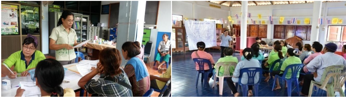
การจัดทำแผนฯใช้กระบวนการมีส่วนร่วม